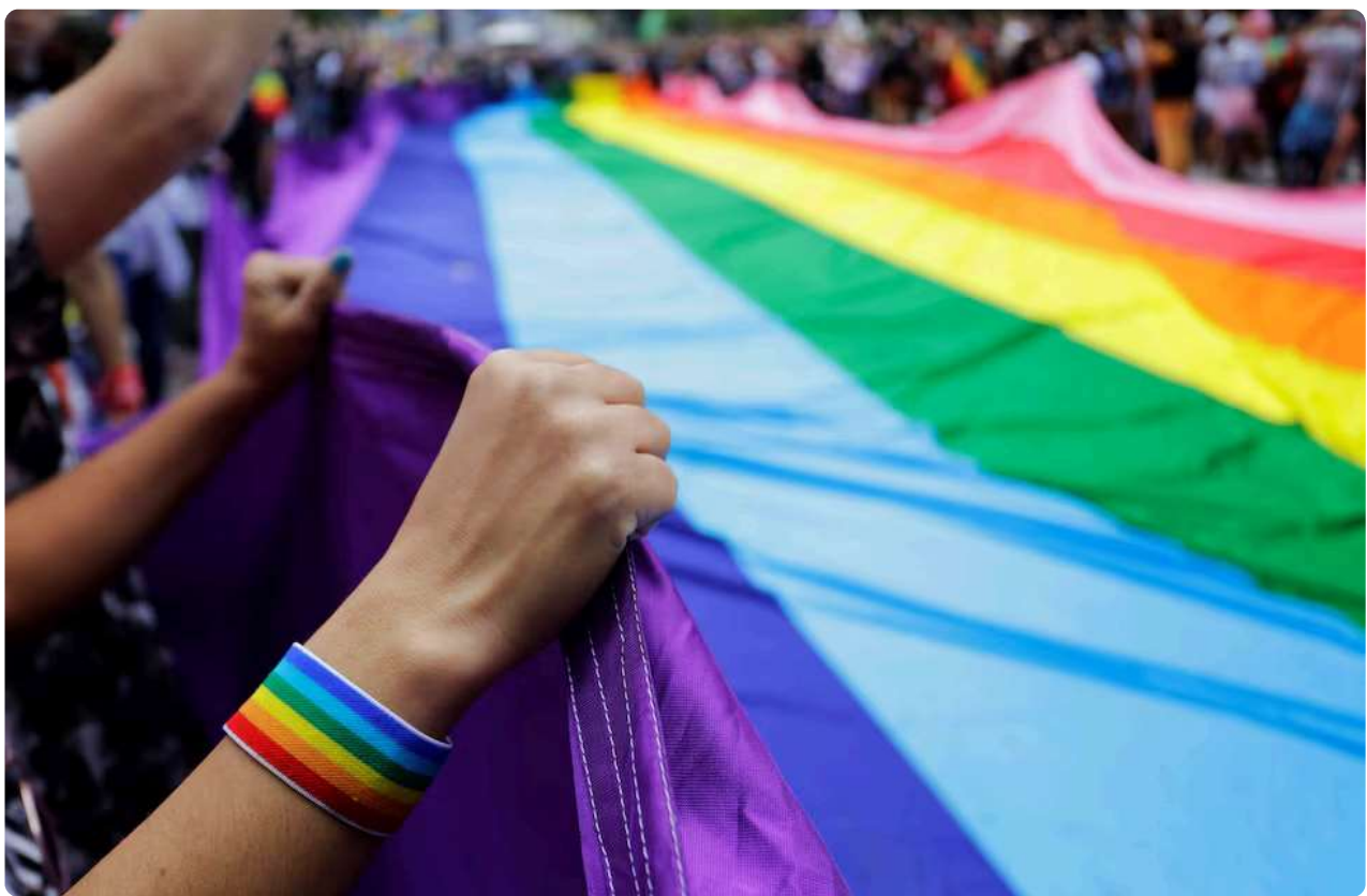
LGBTIQ+. Una encuesta relevó peores condiciones de trabajo y salud mental en este colectivo.

Un estudio realizado por más de 40 investigadores relevó las condiciones de vida de la población LGBTIQ+ en todo el país. El proyecto se denomina “ Censo Diversidad ” y sus resultados fueron presentados el martes en el Palacio Ferreyra.